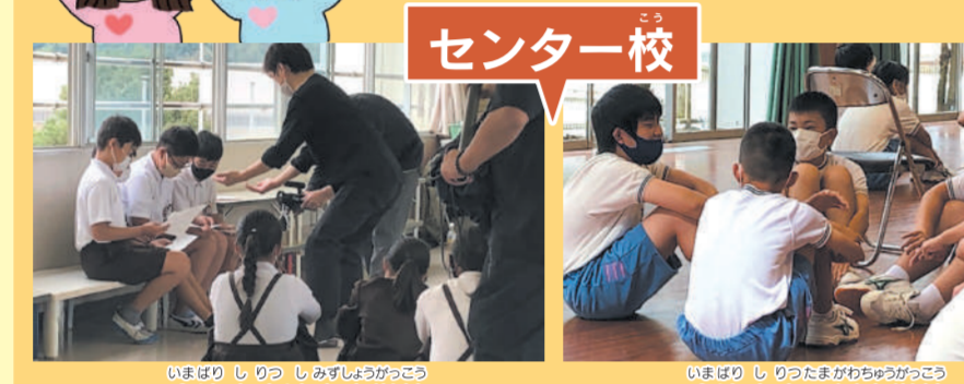
センター校 今治市立清水小学校 今治市立玉川中学校

ライブ授業の前に、センター校2校とリモート校4校で、劇を通して、相手のことを知り、相手の立場になってみたりする、ワークショップを行ったよ。