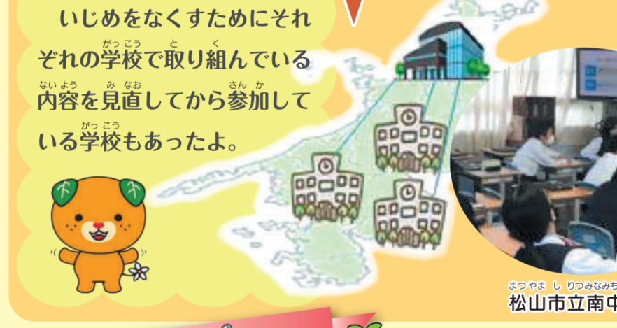
409校 サテライト校 いじめをなくすためにそれぞれの学校で取り組んでいる内容を見直してから参加している学校もあったよ。