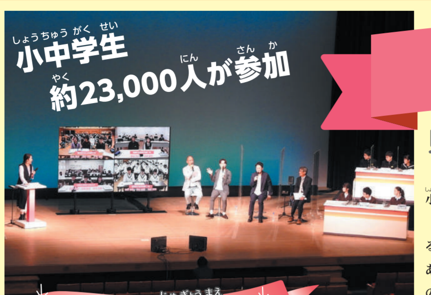
小中学生 約23,000人が参加 ライブ授業前

ライブ授業の前に、センター校2校とリモート校4校で、劇を通して、相手のことを知り、相手の立場になってみたりする、ワークショップを行ったよ。