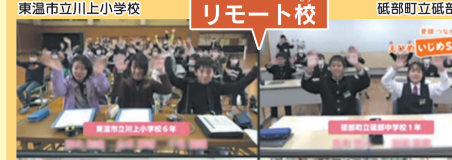
リモート校 東温市立川上小学校 砥部町立砥部中学校